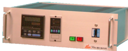
専用温度コントローラー 19ラック・JIS取手付480タイプ 定電力位相制御サイリスター搭載

1500°Cまでの高温管状炉です。軽量小型化した為に使い易く、消費電力も少なくて済みます。また垂直にての使用も可能です。より温度精度の良いサイリスター定電力位相制御を組み合わせることにより高性能な装置としてお使い頂けます。